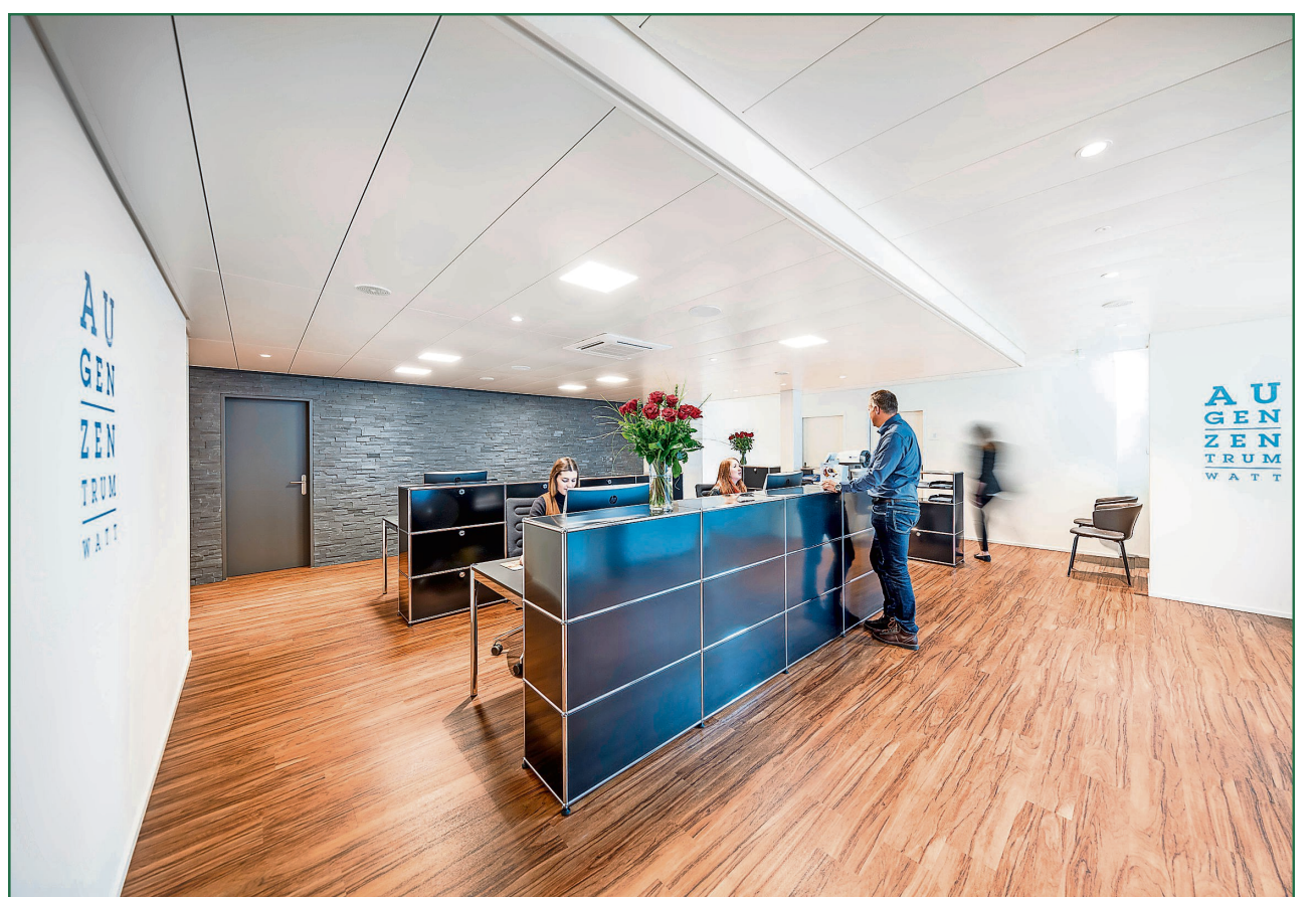
Der Empfangsbereich des Augenzentrums Watt.